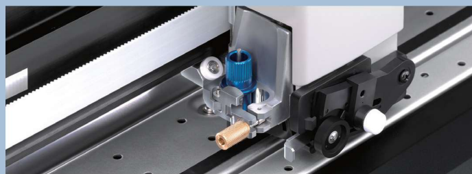
Doppio alloggiamento portalama.

Con una velocità di taglio pari a 1485 mm al secondo, la serie CAMM-1 GR vanta la più alta velocità di produzione nella sua categoria. Il carrello di taglio ottimizzato aumenta la produttività e riduce al minimo la distanza verticale che la lama deve percorrere. Inoltre avanzati strumenti per la creazione di linee guida aiutano l'utente nella fase di spellicolatura del lavoro.