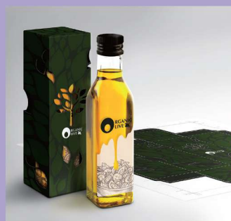
Etichette e prototipi di packaging