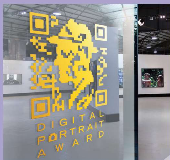
Grafiche per vetrine

Per migliorare il caricamento del materiale, i plotter da taglio GR dispongono di pinch roller elettronici, che hanno più di 10 modalità di settaggio della pressione, per tenere anche i materiali più difficili, come floccati, oscuranti per vetri e materiali riflettenti spessi.